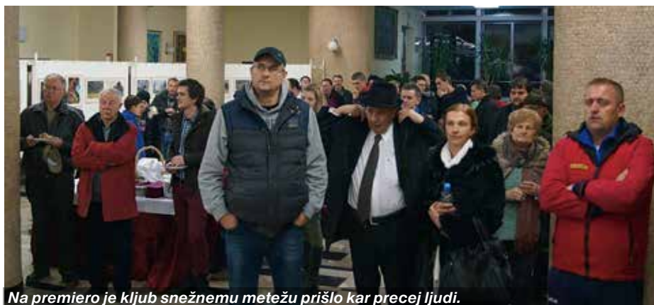
Na premiero je kljub snežnemu metežu prišlo kar precej ljudi.

Slovenski strokovnjaki z veterinarske in biotehniške fakultete v filmu na preprost način predstavijo in potrdijo pomen te pasme in nujnost ohranitve. Opravljene genetske raziskave in izsledki potrjujejo, da bosanski planinski konj predstavlja zelo staro populacijo, ki že nekaj tisoč let prebiva na območju Balkana. Strokovnjaki na osnovi ugotovitev poudarjajo, da je pasma zelo pomembna zaradi svoje prvinskosti, saj so dokazali, da ima prisotne osnovne prvinske gene. Prav tako poudarjajo, da je po vseh kriterijih pasma kritično ogrožena.