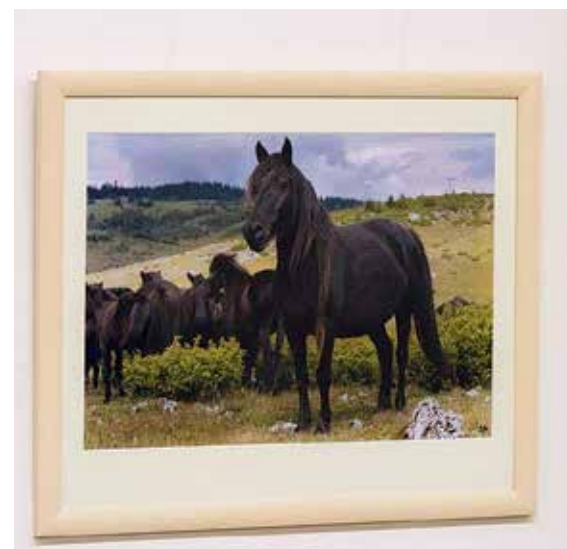
Razstava fotografij bosanskih planinskih konj Branka Klančarja.

pomoči države. Skupno število bosanskih planinskih konj v čisti krvi trenutno znaša manj kot 200, število plemenskih živali manj kot 100 in efektivno število okoli 30 (Efektivna velikost populacije je povprečno število živali v neki populaciji, ki prispeva gene za naslednjo generacijo.), medtem ko je bilo nekdanj v Jugoslaviji teh konj v tipu skoraj pol milijona.