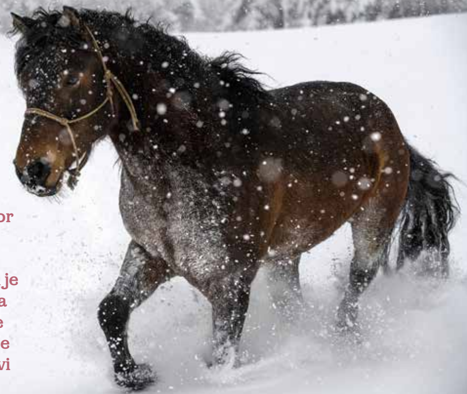
Bosanski planinski konji so vredni ohranitve.

V Kulturnem centru delavski dom v Zagorju ob Savi je bila 2. februarja 2018 predpremiéra dokumentarnega filma Bosanski planinski konj na robu preživetja . Ekípa Regionalnega centra Maribor TV Slovenije pod vodstvom Mojce Recek, urednice oddaje O živalih in ljudeh , ki je avtorica filma, je predstavila kruto usodo nekdanj največje in najbolj uporabljane pasme konj v nekdanji skupni državi Jugoslaviji.